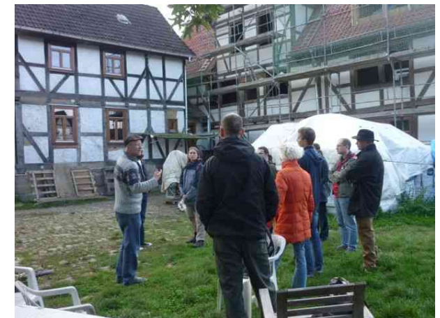
Seminargruppe auf dem Lossehof

Die fünf Kommunen sind Teil des Netzwerkes der politischen Kommunen „KommuJa“. Infos über das KommuJa-Netzwerk gibt es im Netz unter: www.kommuja.de