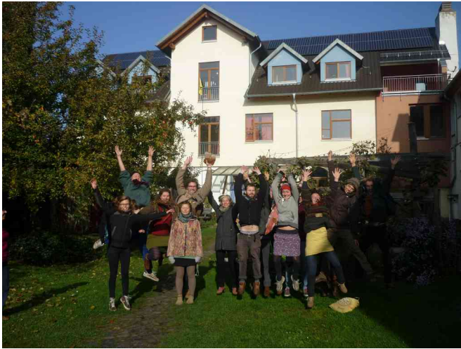
Seminargruppe in Niederkaufungen