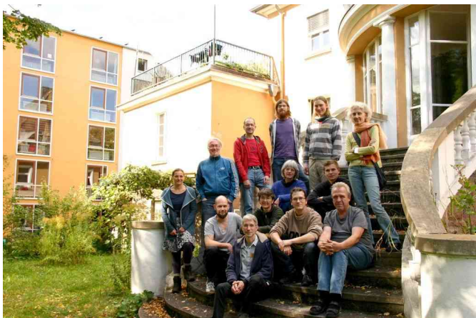
Seminargruppe in der Villa Locomuna

Alle Gruppen wirtschaften gemeinsam in eine Kasse und treffen ihre Entscheidungen im Konsens. Im Laufe der Jahre haben sich die fünf Kommunen in der Region Kassel immer mehr vernetzt und gemeinsame Projekte auf den Weg gebracht wie die „Solidarische Landwirtschaft“ (Solawi) und andere gruppenübergreifende Arbeitskollektive.